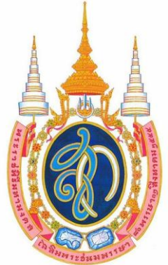
ตราสัญลักษณ์พระราชพิธีมหามงคลเฉลิมพระชนมพรรษา ๘๐ พรรษา ในสมเด็จพระนางเจ้าฯ พระบรมราชินีนาถ ๑๒ สิงหาคม ๒๕๕๕

ต่อมาสมาคมครูคาทอลิกแห่งประเทศไทย ได้จัดงานวันแม่ขึ้นอีกครั้ง ในวันที่ ๔ ตุลาคม พ.ศ. ๒๕๑๕ แต่จัดได้เพียงปีเดียวเท่านั้น จนกระทั่งในปี พ.ศ. ๒๕๑๙ คณะกรรมการอำนวยการสภาสังคมสงเคราะห์แห่งประเทศไทย ในพระบรมราชูปถัมภ์จึงได้กำหนดวันแม่ขึ้นใหม่ให้เป็นวันที่แน่นอน โดยถือเอาวันเสด็จพระราชสมภพของสมเด็จพระนางเจ้าสิริกิติ์ พระบรมราชินีนาถ คือวันที่ ๑๒ สิงหาคม ของทุกปีเป็นวันแม่แห่งชาติ